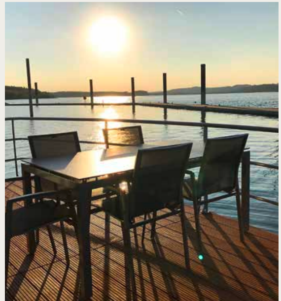
Sonne, See und unverbauter Blick: Wer will hier nicht Platz nehmen und den Abend gemütlich ausklingen lassen?

von der Wasseroberfläche, und während rundum der Brombachsee leise erwacht, gibt es den ersten Kaffee auf dem Sonnendeck. Die schwimmenden Häuser sind zudem perfekt und komfortabel ausgestattet. Auf einer Wohnfläche von 44 Quadratmetern bieten sie zwei Schlafzimmer, ein WC, ein Badezimmer sowie einen Wohn-Essbereich mit Rundum-Panoramablick. Für die heißen Sommertage stehen zwei Terrassen zur Verfügung, die allein auf eine Gesamtfläche von 40 Quadratmetern kommen. Und wer die Ruhe auf dem See in der kälteren Jahreszeit bevorzugt: Auch das geht – zum Beispiel auf der Couch vor den lodernen Flammen im Flüssiggas-Kamin. Alles in allem ein durchdachtes Konzept, das den Service mit einbezieht: Denn der umfasst von der Sieben-Tage-Rezeption über Bettwäsche bis zu Handtüchern eine absolute Rundumversorgung. Der Brombachsee – für Menschen, die im Urlaub einfach nur da sein wollen, ein wirklich schönes Ziel.