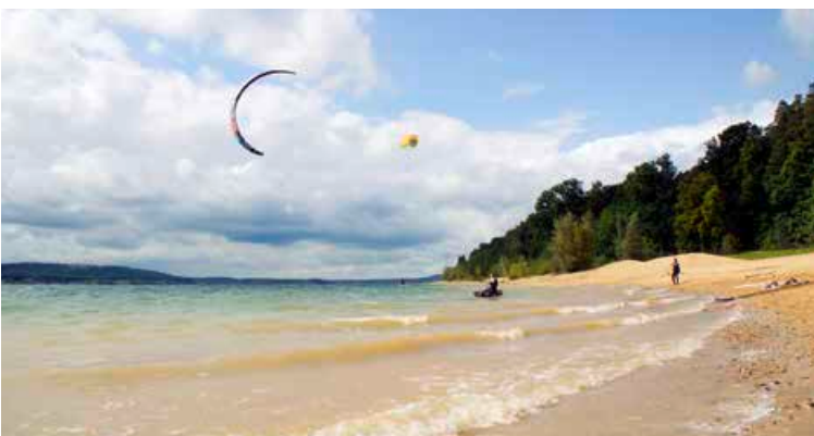
Am Brombachsee geht's auch dynamisch zu: Kite-Surfer am Strand

Der Große Brombachsee ist ein Stausee im Süden Mittelfrankens. Zusammen mit Kleinem Brombachsee und Igelbachsee bildet er den Brombachsee. Im Jahr 2000 eingeweiht, ist er der größte Stausee des Fränkischen Seenlands und mit einer Fläche von neun Quadratkilometern ein Paradies für Segler. In Ramsberg liegt auch der größte Binnensegelfhafen Deutschlands. Wunderschöne Wander- und Radwege bieten zudem viele Möglichkeiten, die Region zu entdecken: zum Beispiel die Hopfen- und Bierstadt Spalt mit ihren urigen Fachwerkhäusern, verwinkelten Gassen und dem modernen HopfenBierGut-Museum. Vogel-Interessierte wiederum können im 45 Hektar großen Naturschutzgebiet des Kleinen Brombachsees auf Fernglas-Beobachtung gehen. Musik-Festivals, Laser-Shows und Feuerwerk sind die Höhepunkte im Sommer. Ob allein, zu zweit oder mit der gesamten Familie: Mehr Infos zum Urlaub am Brombachsee unter www.zv-brombachsee.de